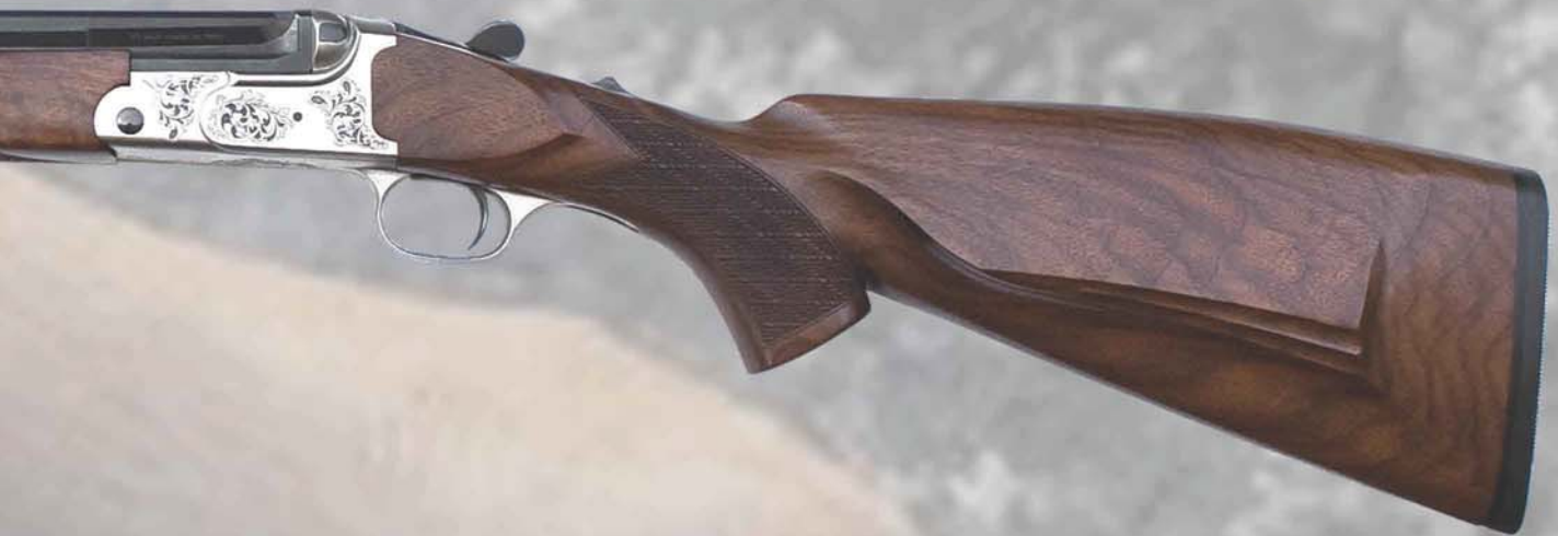
PEGASO BLACK GOLD