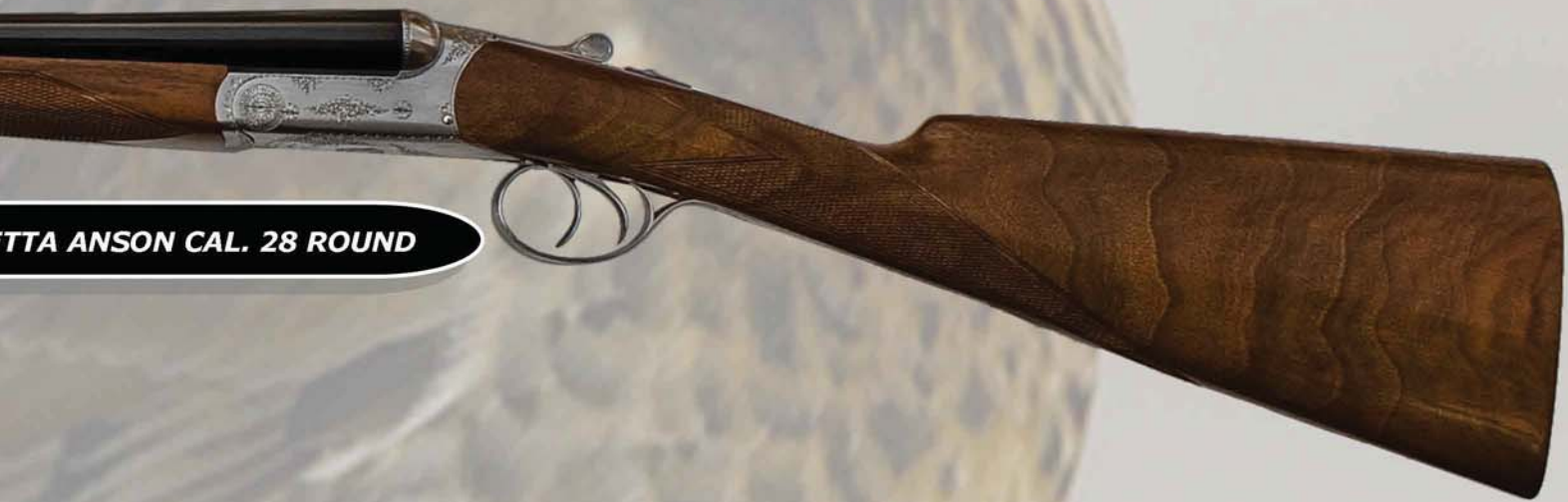
DOPPIETTA ANSON CAL. 28 ROUND