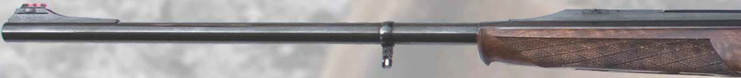
Optional: blocchetto oro gold block