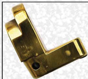
Freno di Bocca / Opening Brake