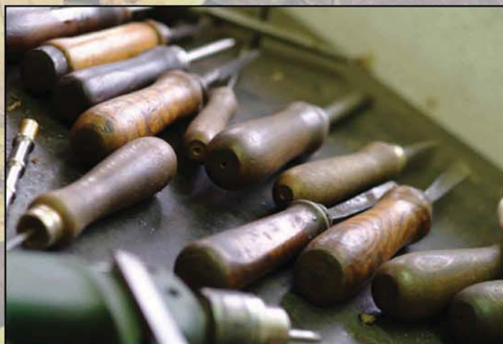
Incisione XL V01 Engraving XL V01

The style of the engravings proposed on Pegaso XL models range from floral motifs, English Scrolls, hunting scenes with animals gold inlays. Their realization is achieved using the most modern techniques of laser engravings. Upon request we carry hand-engraved and personalized.