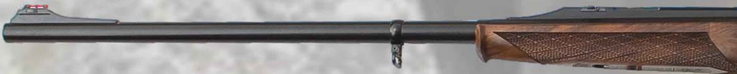
Nel Pegaso Black Gold il blocchetto oro è di serie. In the Pegaso Black Gold the gold block is included.