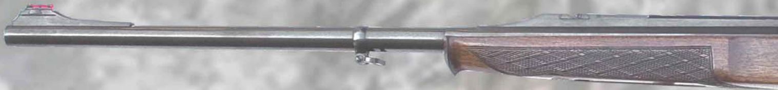
Mirino in fibra ottica Fiber optic front sight