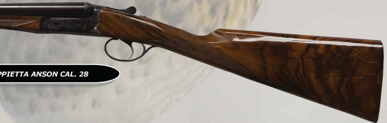
DOPPIETTA ANSON CAL. 28